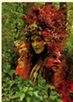
Gäa und Troll